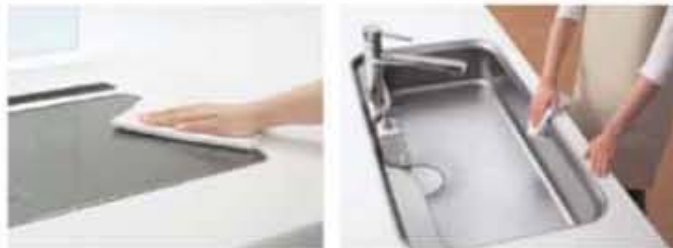
IHからカウンター・シンクまで、ほぼフラットだから一気に拭けます。

カウンターとシンクのスキマが少なく汚れにくいから、拭くだけでキレイに。ゆとりの時間が生まれます。